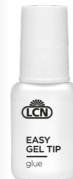
EASY GEL TIP GLUE, 10 G Art.-Nr.: 97942

Hier geht's zum Anwendungsvideo auf unserem Youtube-Kanal!