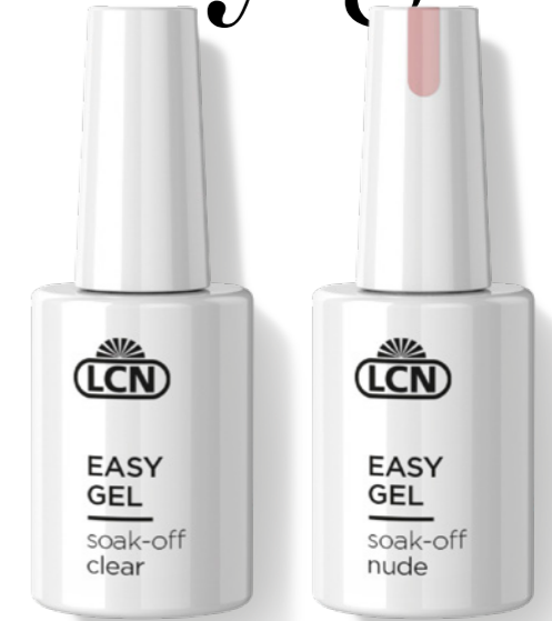
EASY GEL SOAK-OFF CLEAR, 10 ML Art.-Nr.: 97928-1