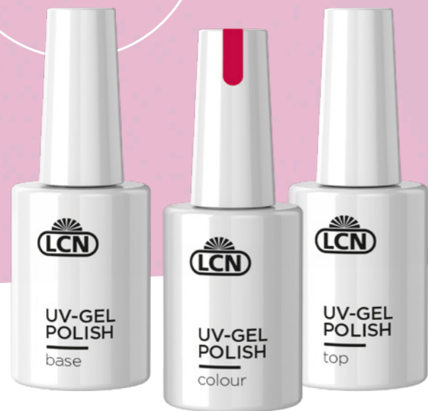
UV-GEL POLISH BASE COAT, 10 ML